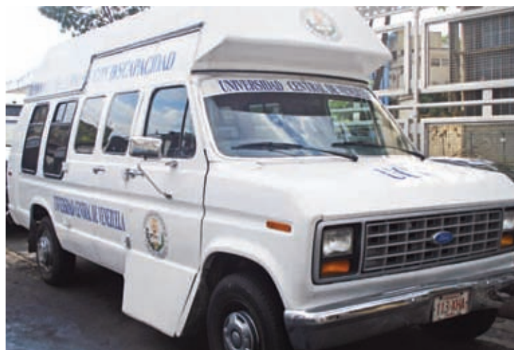
La unidad acondicionada para el traslado de las personas con discapacidad

"Cabe destacar que el servicio no será personalizado, y se prestará solo en los horarios ya especificados debido a que